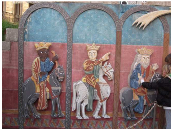
Begehbare Weihnachtsgeschichte, Fußgängerzone Barcelona, Advent 2011

Begehbare Krippe : Stationen der Weihnachtsgeschichte mit großen Figuren in einem abgegrenzten Bereich können im Einbahnstraßensystem abgegangen werden.